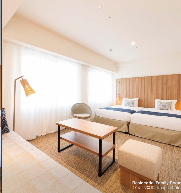
Residential Family Room (イメージ写真/Image photo)