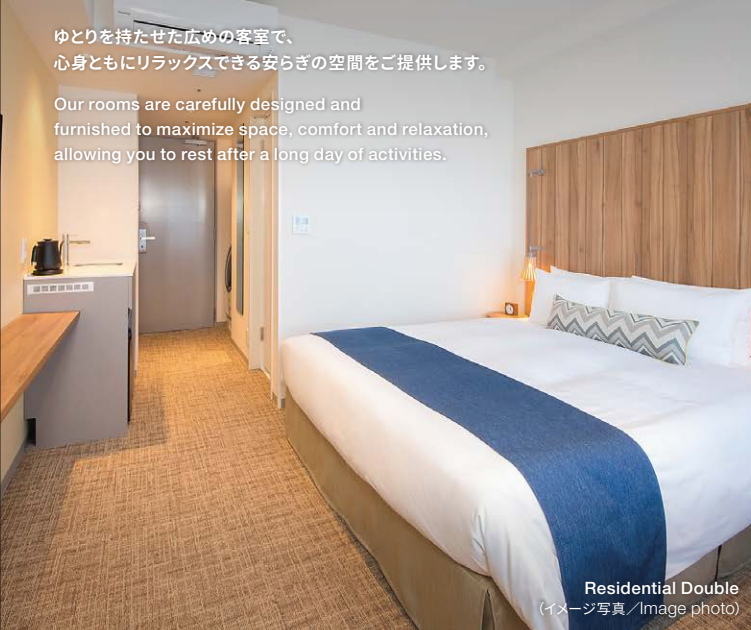
Residential Double (イメージ写真/Image photo)

Our rooms are carefully designed and furnished to maximize space, comfort and relaxation, allowing you to rest after a long day of activities.