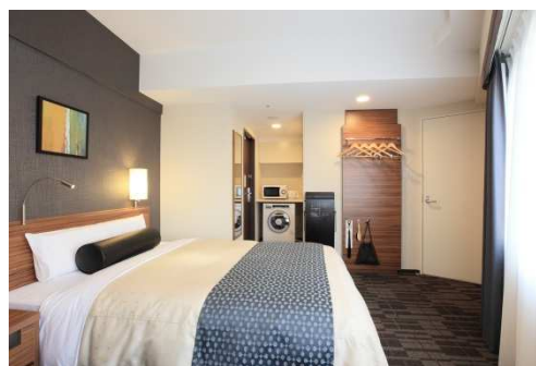
【西新宿店 客室内の洗濯乾燥機、電子レンジ等】